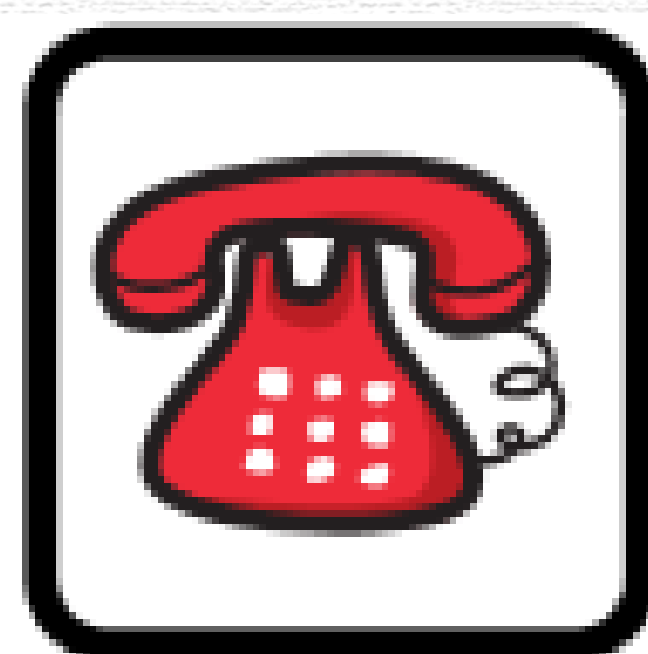
Bezpłatna pomoc telefoniczna