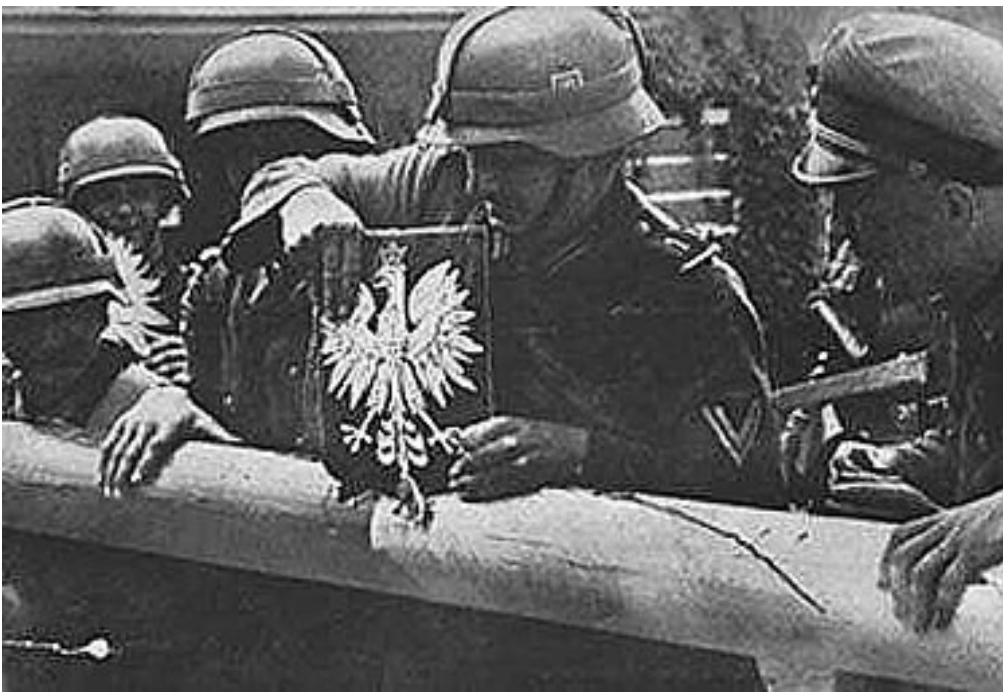
Granica – zrywanie godła Polski

1 września 1939 roku o godzinie 4.45 Niemcy hitlerowskie łamiąc pakt o nieagresji dokonały napaści na Polskę będącą początkiem II wojny światowej. Niemiecki pancernik „Schleswig-Holstein” rozpoczął ostrzał polskiej placówki wojskowej na Westerplatte. Tego samego dnia, we wczesnych godzinach rannych, Niemcy uderzyli na Poczta Polską w Wolnym Mieście Gdańsku. Niemiecki plan ataku na nasz kraj przewidywał wojnę błyskawiczną, której celem miało być przełamanie polskiej obrony, a następnie okrążenie i zniszczenie głównych sił przeciwnika w ciągu tygodnia. Mimo bohaterskiej obrony polskich żołnierzy, agresor posiadał przewagę liczebną oraz techniczną we wszystkich rodzajach wojsk. W ciągu miesiąca opanował zachodnie i centralne terytoria Polski.