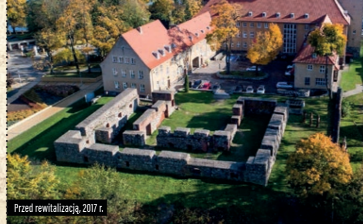
Przed rewitalizacją, 2017 r.

W opracowaniu wykorzystano fotografie Gminy Miejskiej Szczytno i Muzeum Mazurskiego w Szczytnie Oddział Muzeum Warmii i Mazur w Olsztynie