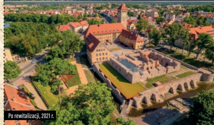
Po rewitalizacji, 2021 r.