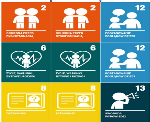
Film edukacyjny „Wszyscy mamy prawa”