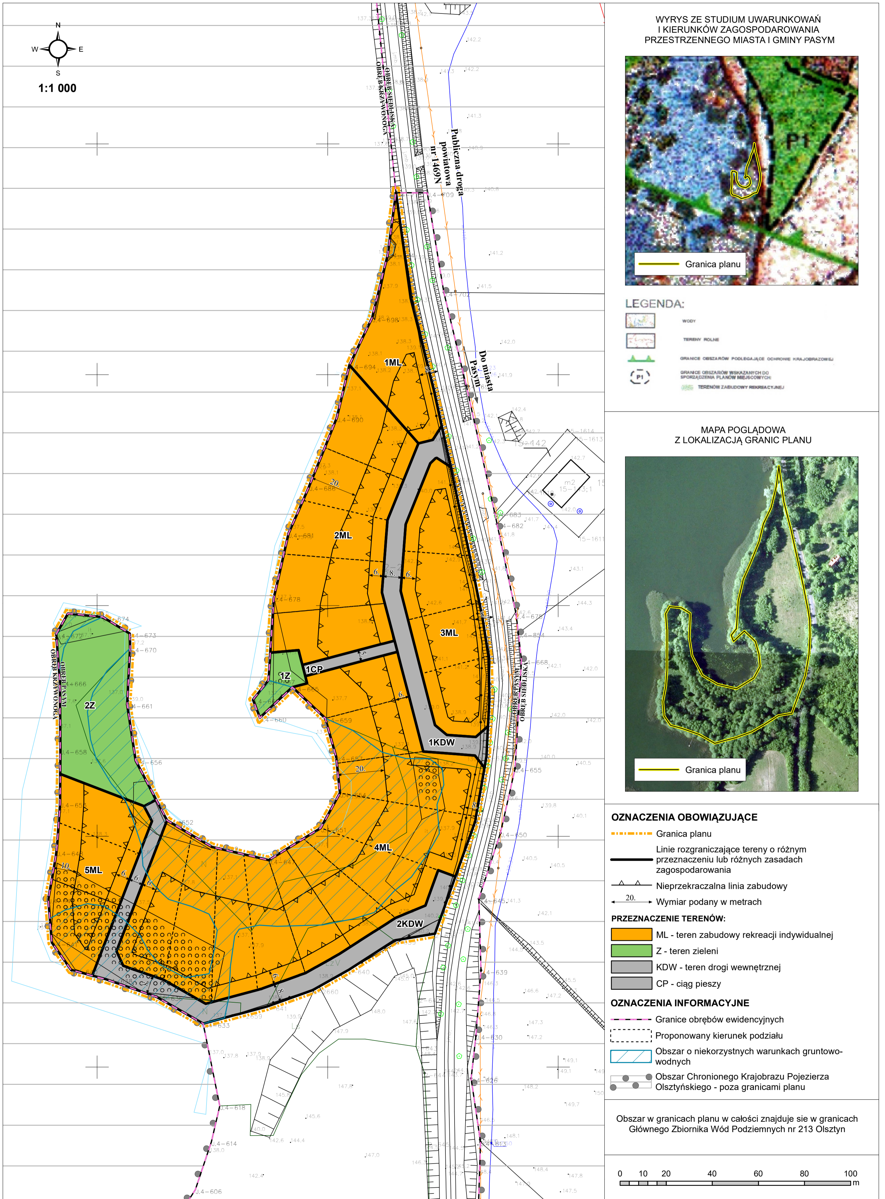
WYRYS ZE STUDYUM UWARUNKWAŃ I KIERUNKÓW ZAGOSPODAROWANIA PRZESTRZENNEGO MIASTA I GMINY PASYMI