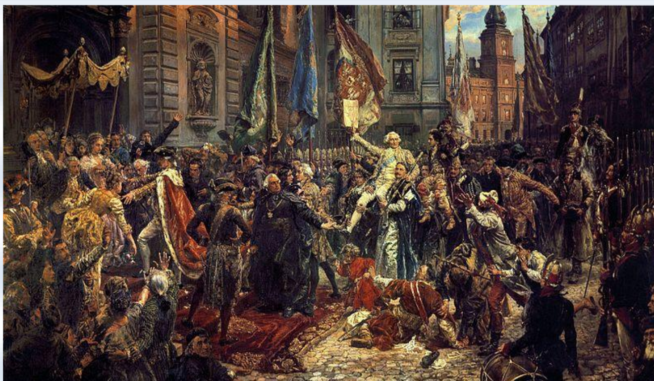
Jan Matejko, Konstytucja 3 maja

Mocą Konstytucji wprowadzono trójpodział władzy. Władzę ustawodawczą miał sprawować dwuizbowy parlament, władzę wykonawczą – król i Straż Praw, sędowniczą niezawisłe sądy. Zniesiono wolną elekcję, po śmierci Stanisława Augusta tron miał być dziedziczny przez dynastę Wettinów w saskiej linii. Zniesiono również liberum veto. Mieszczanie uzyskali prawa zapisane w Ustawie o miastach królewskich a chłopci mieli być wzięci „pod opiekę prawa”.