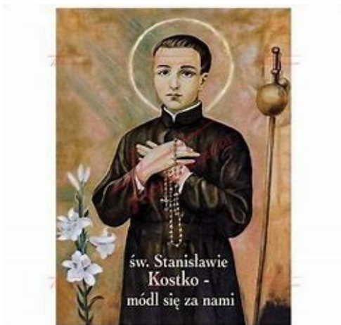
św. Stanisławie Kostko - módl się za nami

Czy rozpoznajecie kogoś na tych ilustracjach?