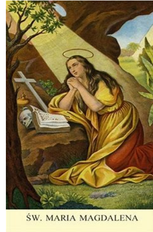
ŚW. MARIA MAGDALENA

Czy rozpoznajecie kogoś na tych ilustracjach?