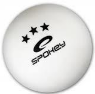
pileczka do ping-ponga