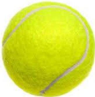
piłeczka do tenisa