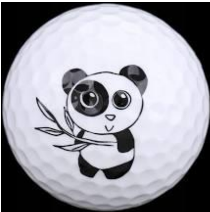
piłeczka do golfa

Różne piłki, np. piłeczka do golfa, piłka do tenisa, piłka nożna. Rodzic prezentuje dzieciom poszczególne piłki. Prosi, aby dzieci powiedziały, jakie one są i czym się od siebie różnią. Wspólnie z dziećmi próbuje odnaleźć cechę wspólną – odpowiedzieć na pytanie: Do czego służą wszystkie te piłki? (Do zabawy/do gry)