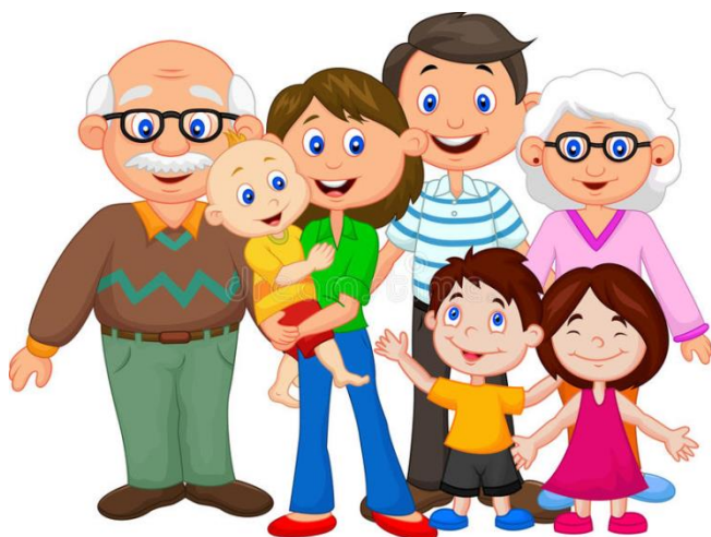
Nazwij członków rodziny