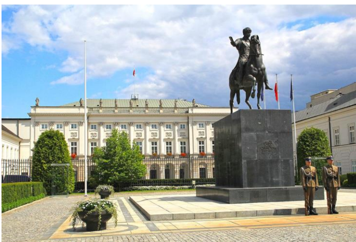
Pałac Prezydencki. Jest największym pałacem w Warszawie.