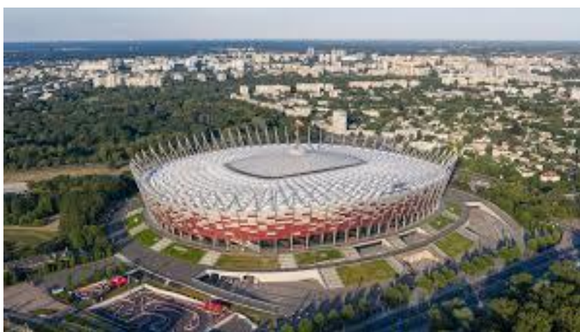
Stadion Narodowy w Warszawie.