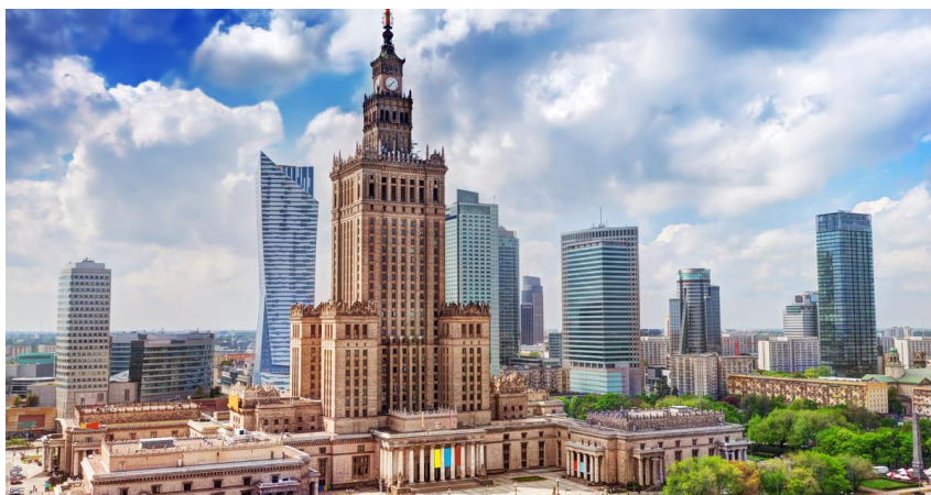
Pałac Nauki i Kultury w Warszawie. Jest to najwyższy budynek w Polsce.

Tak jak obiecałyśmy zabieramy Was na małą wycieczkę po Warszawie.