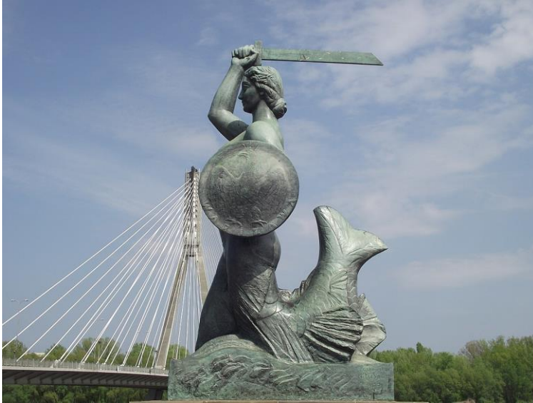
Pomnik Syreny w Warszawie.