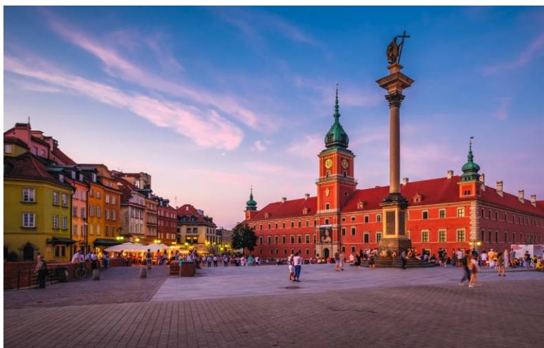
Plac zamkowy w Warszawie.