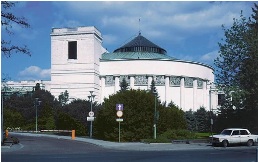
Budynek Sejmu w Warszawie.