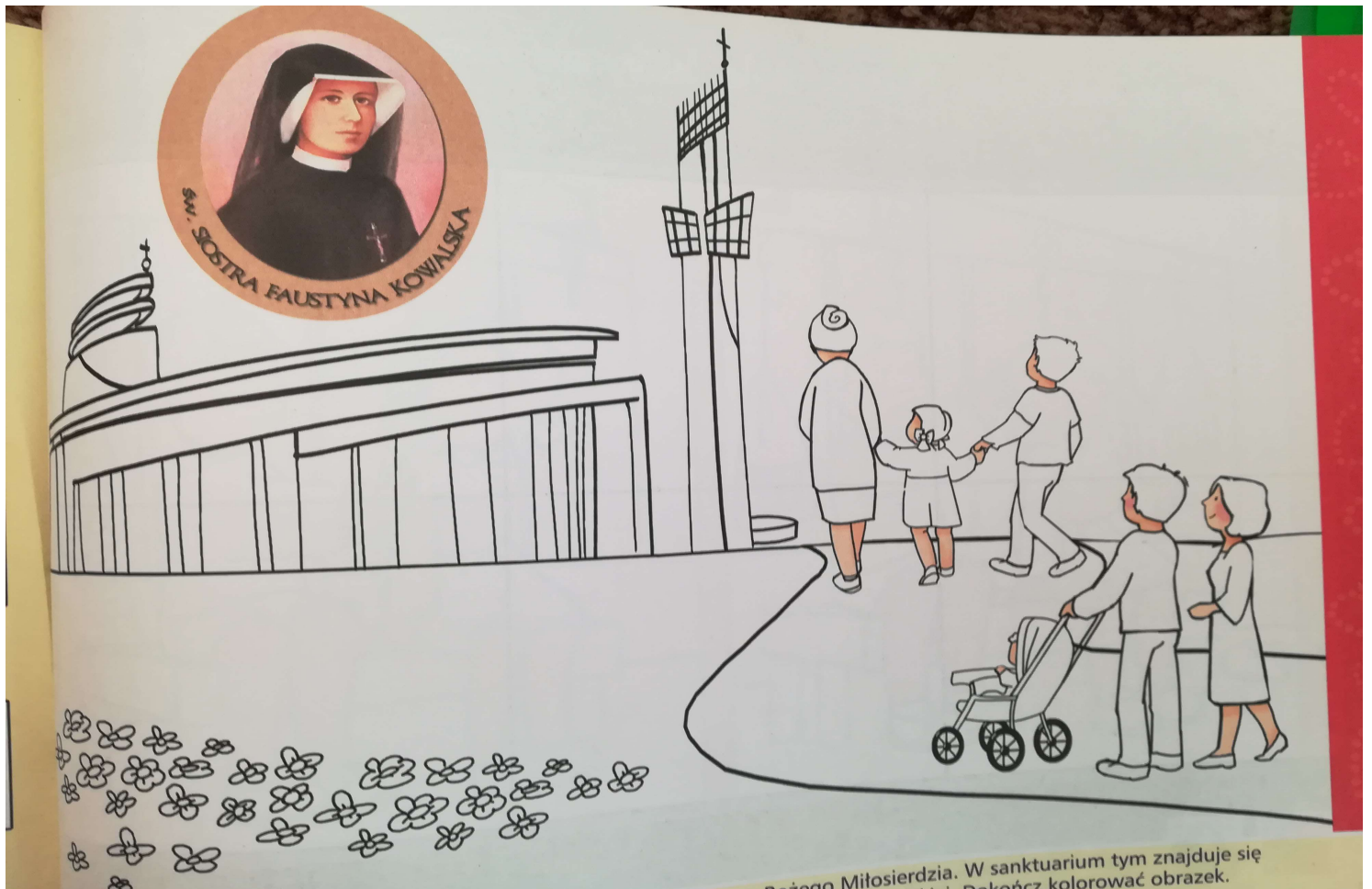
W sanktuarium tym znajduje się... Dokończ kolorować obrazek.