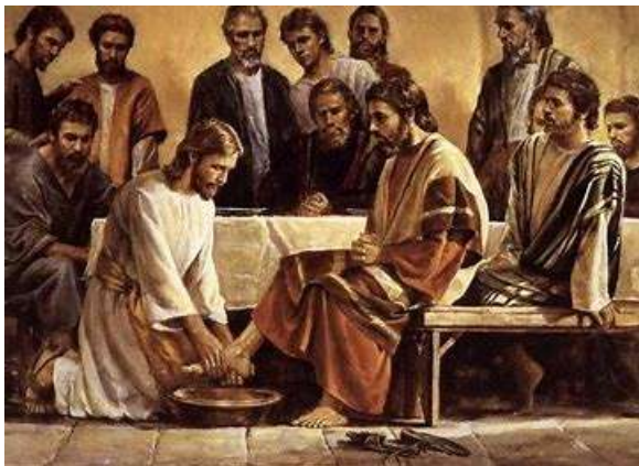
Jezus zaprosił swoich dwunastu przyjaciół na ucztę.

Na początku ucztę wziął naczynie z wodą i ręcznik, aby umyć wszystkim nogi. Klękał przed każdym z przyjaciół i obmywał im stopy. Był to gest oznaczający miłość i pokorę wobec innych. Kiedy wszyscy zasiedli za stołem, Jezus rzekł do nich: – Chciałbym dać wam dobrą radę: pamiętajcie, że najważniejszą sprawą w życiu jest kochać dobrego Boga i być dobrym dla innych. Następnie poprosił ich: – Jestem waszym przyjacielem i chcę, żebyście byli tak dla siebie dobrzy, jak ja jestem dobry dla was. Kto chce być moim przyjacielem, ten powinien być dobry dla innych. Później wszyscy zasiedli do uroczystej kolacji.