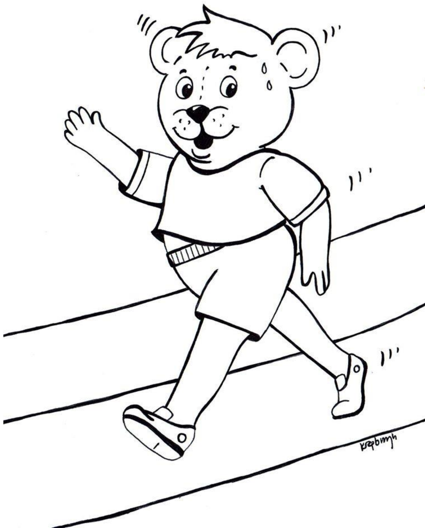
Kolorowanka, autor: Misiowa Mama, załącznik nr 2