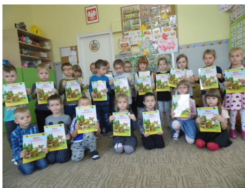
Lis duży czy mały? – działanie dzieci na kartach pracy